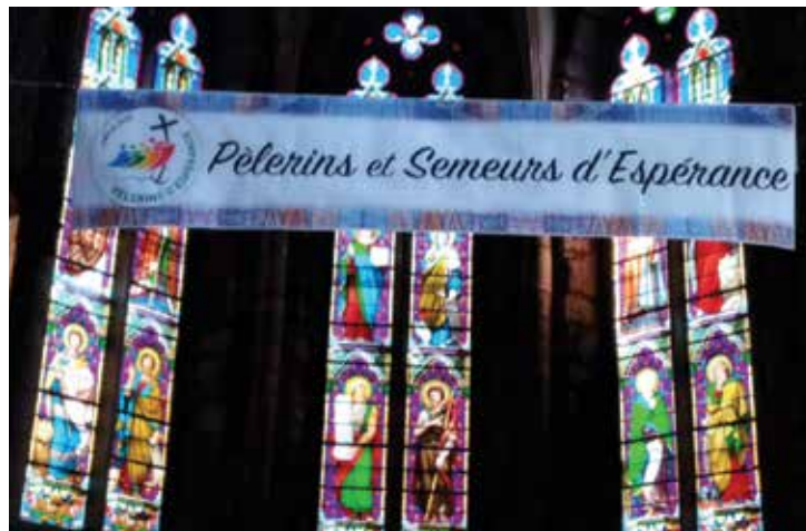
Dans l'entrée de l'église, les fidèles ont participé généreusement à la vente des petits sachets de riz...